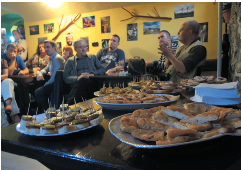
Z otvorenia výstavy PRESSOV PAPARAZZI III.