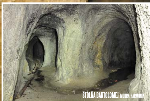
ŠTŔLŇA BARTOLOMEJ, MODRA-HARMONIA