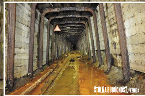
ŠTŔLŇA BUDÚCNOSŤ, PEZINOK