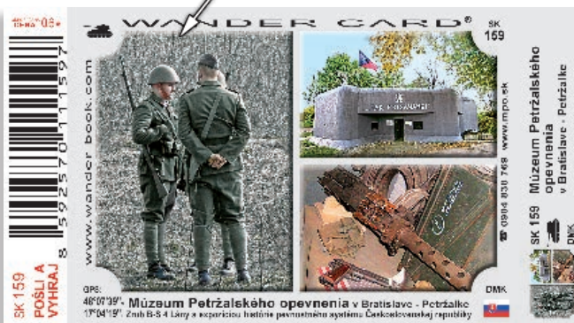
koláž z 3 fotografií (1x na výšku 2x na šírku)