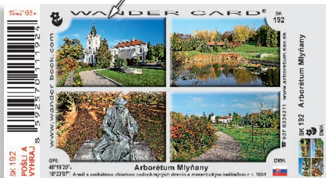
koláž zo 4 fotografií