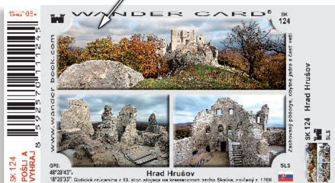
koláž z 3 fotografií (1x panorama, 2x na šírku)