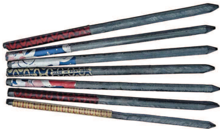
Griflíky zo začiatku XX. storočia vyrábčovia z Francúzska a Portugalska