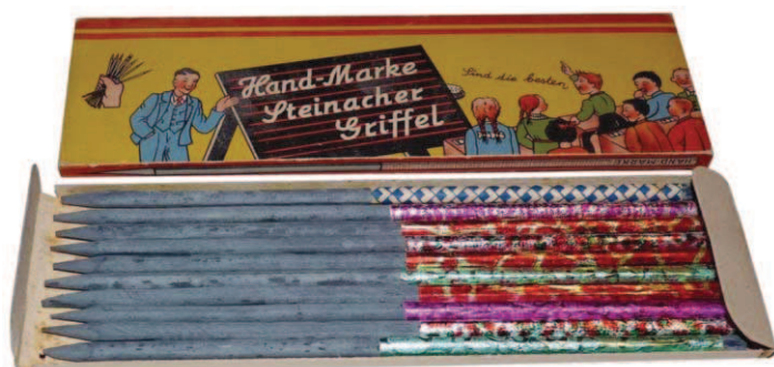
Sady griflíkov zo začiatku XX. storočia vyrábca: neuvedený na obale, Nemecko