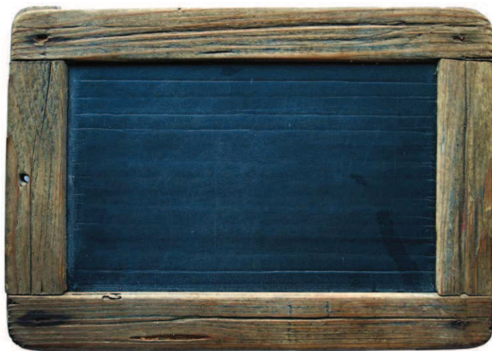
Bridlicová školská písacia tabuľka z druhej polovice XIX. storočia.