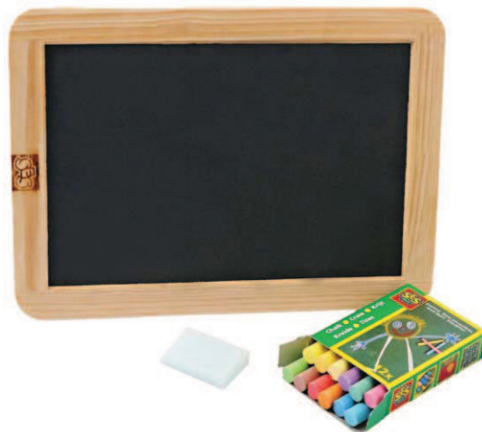
Bridlicová školská písacia tabuľka s farebnými kriedami a hubkou súčasného výrobcu: SES, Holandsko