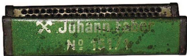
Struhadlo na griflík z konca XIX. storočia vyrábca: Johann Faber, Nemecko