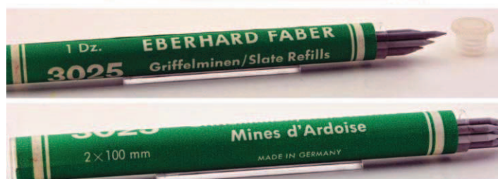
Náplň - "tuha" z bridlice do versatíliek zo začiatku XX. storočia vyrábca: Eberhard Faber, Nemecko